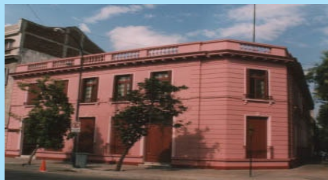
Casa central de la Corporación de Bienestar SERBIMA

También puede obtener más detalles sobre los beneficios, servicios y requisitos para hacerse socio, visitando la página web: www.serbima.cl o contactándose al correo: atencionsocios@serbima.cl